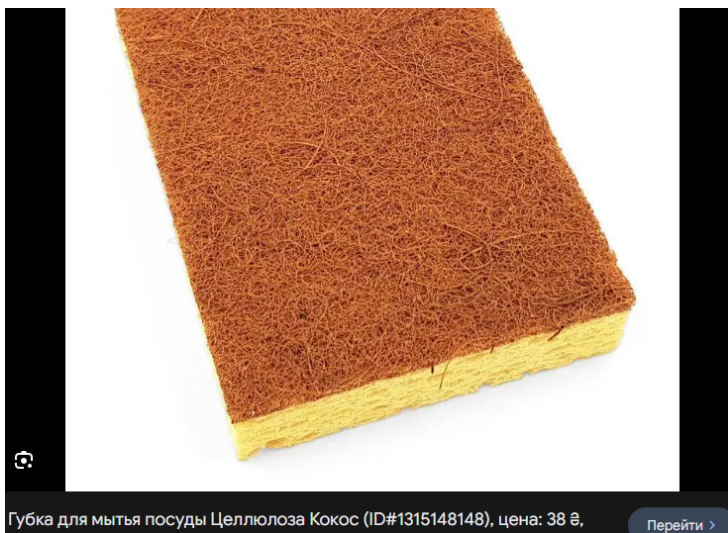
Губка для мытья посуды Целлюлоза Кокос (ID#1315148148), цена: 38 ₺.